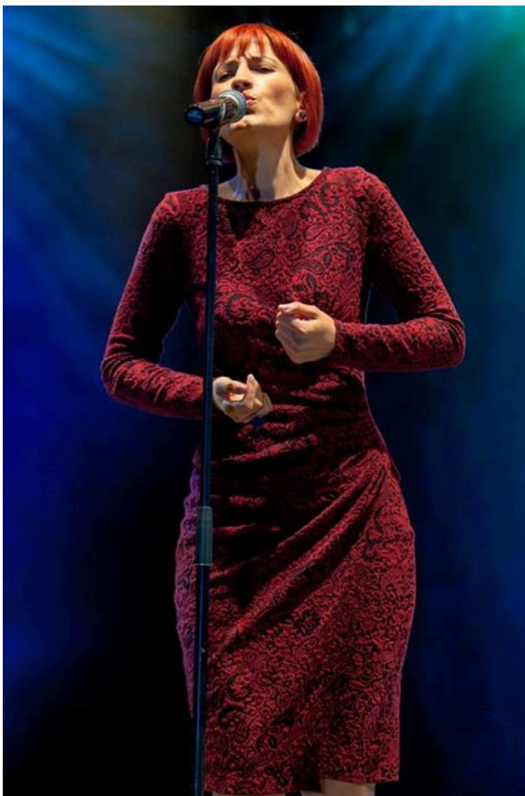
Diana Tudor în concert la Bucharest Music Film Festival, 2015